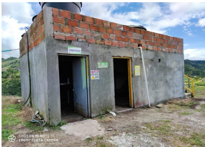
CENTRO ACOPIO COSECHA