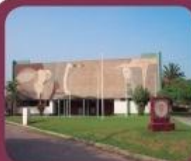
Auditorio Principal de la FMV

Nota: Los pagos se realizaran presentando el DNI del postulante debiendo verificar sus datos antes de retirar de la ventanilla, cualquier error será responsabilidad únicamente del postulante.