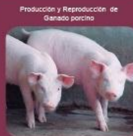
Producción y Reproducción de Ganado porcino