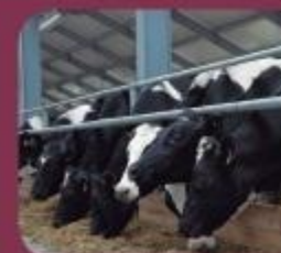
Producción y Reproducción de Ganado Vacuno